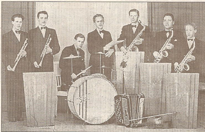
Lasses dansorkester från Toreboda år 1946.

Då bildades också dansorkestrarna. En populär sådan i Liljebacken var Luffarkapellet från Karlsborg. Här visas en bild av